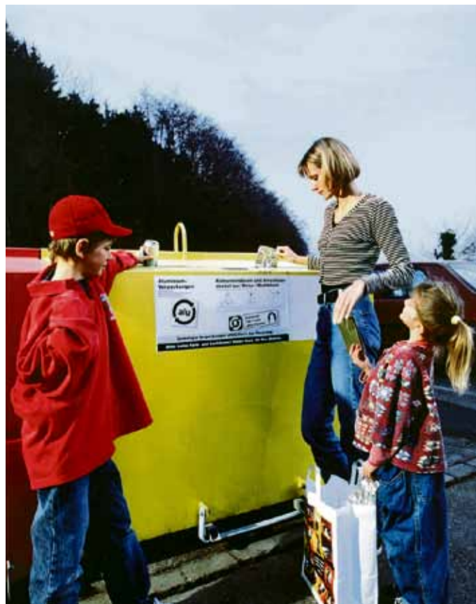
Weltmeister: Die Schweiz hat die höchste Sammelquote der Welt bei Alu-Dosen.